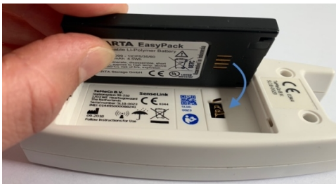
Afbeelding 3: correct verwisselen accu

Let op: voelt u dat het klepje niet goed dicht gaat? Controleer dan of u de accu juist geplaatst heeft (zie afbeeldingen 3 en 4).