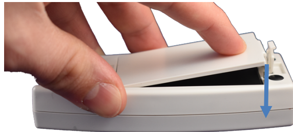
Afbeelding 4: correct sluiten van het klepje