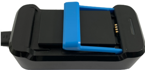
Afbeelding 5: onjuist geplaatste accu

U krijgt een oplader en een extra accu mee naar huis. Het is belangrijk dat u de lege accu uit de recorder oplaadt. Zorg ervoor dat de accu goed in de oplader geklikt wordt. Gemiddeld duurt het opladen van een accu 2 uur . Zodra het lampje van de oplader continu groen brandt, is de accu volledig opgeladen (zie afbeeldingen 5 en 6).